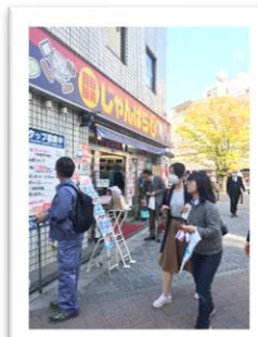
じゃんぱら秋葉原4号店