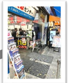
イオシス買取センター