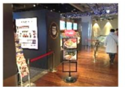
秋葉原拉麺劇場 (UDX アキバ・イチ)